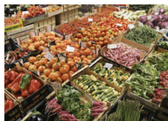
Magazzini conservazione frutta e verdura