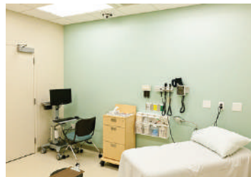
Ambulatori medici o dentistici