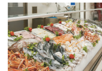
Magazzini conservazione pesce